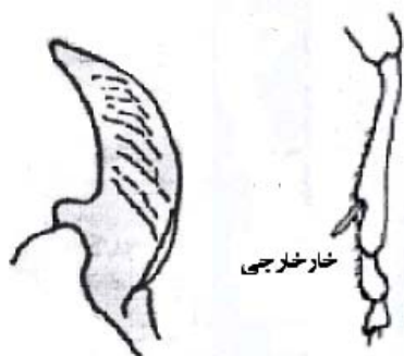
شکل ۲- ساق پای جلو (الف) و آرواره های بالا (ب) در گونه های جنس C. auropunctatum dsungaricum (شکل ها از نگارندگان).

Gebler: این گونه متعلق به زیر خانواده Carabinae است. در افراد کامل این زیر خانواده طول بدن حدود ۱۸ میلی متر یا کمی بیشتر است. ساق پای جلو در سمت داخلی خود فاقد فرو رفتگی عمیق بوده ولی دارای یک خار خارجی است (شکل ۲-الف) و شکم دارای ۶ یا ۸ بند قابل رویت است. یکی از ویژگی های مهم این گونه وجود شیارهای فرورفته بر روی آرواره های بالا حشرات بالغ است که حالت چروکیده به آرواره ها می دهند (شکل ۲-ب). تعدادی از گونه های جنس کالوزوما از تخم و پوره های سن گندم تغذیه می کنند (۳).