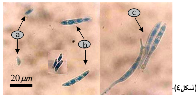
(شکل ۴) - (c) ماکرو کنیدی های در حال جوانه زنی (خط مقیاس ۲۰ میکرومتر)