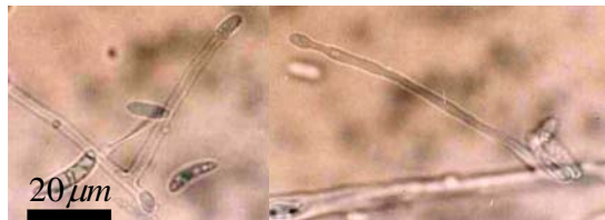
(شکل ۵) - فیالیدهای بلند قارچ Fusarium solani (خط مقیاس ۲۰ میکرومتر)