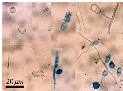
(شکل ۶) - کلامیدوسپور انتهایی و بین ریشه ای قارچ Fusarium solani (خط مقیاس ۲۰ میکرومتر)