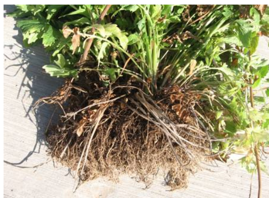
(شکل ۱) - علائم بیماری پوسیدگی طوقه، ریشه و ریزوم گیاه دارویی سنبل الطیب

شناسایی کامل قارچ از روش پارمتر و وایتنی (۱۱) و (۱۰، ۱۶) استفاده شد. ریشه های آن دارای قطر های متفاوت با انشعابات زاویه قائمه تا حاده بودند. در قاعده انشعابات فرورفتگی مشخص دیده شد که دیواره عرضی کمی بالاتر از محل فرورفتگی در انشعابات مشاهده شدند. سلولهای مونیلیوئید قارچ بصورت زنجیره های ساده و منشعب و بشکلهای شکل به رنگ شفاف تا قهوه‌ای مشاهده گردیدند (شکل ۲). ریشه قارچ روی محیط کشت PDA در ابتدا سفید رنگ بوده که به تدریج کرم تا خاکستری رنگ شد و اسکلرت تولید نگردید. قطر ریشه ها بین ۵ تا ۹/۸ میکرومتر اندازه گیری شد. بعد از رنگ آمیزی قارچ با محلول سافرانین در هر سلول ریشه ۳ تا ۷ هسته مشاهده گردید (شکل ۳) و بر همین اساس گونه این جدایه R. solani تشخیص داده شد (۱۱) که سلول های تسبیحی (moniloid cells) به اندازه ۱۱/۱ تا ۱۴/۲ میکرومتر بودند.