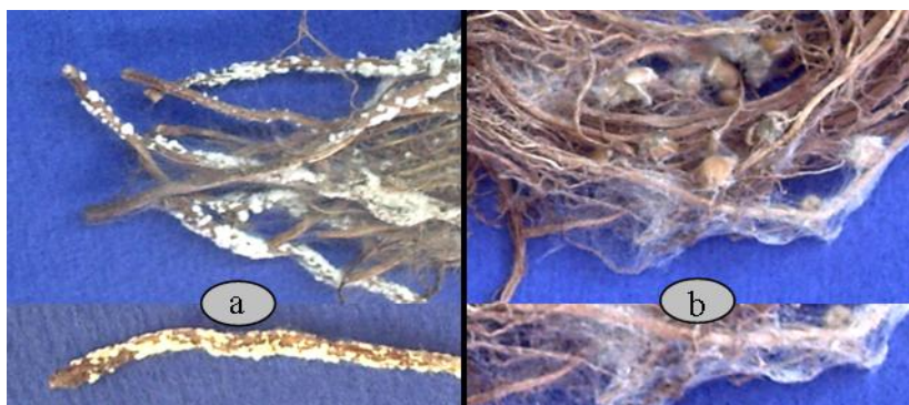
(شکل ۷) - کلنیزه شدن ریشه و ریزوم های گیاه دارویی سنبل الطیب توسط قارچ های

Fusarium solani (b) , Rhizoctonia solani (a)