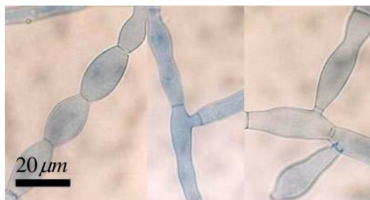
(شکل ۲) - ریشه و سلول های تسبیحی قارچ Rhizoctonia solani (خط مقیاس ۲۰ میکرومتر)

ماکرو کنیدیوم ها اکثرا دوکی شکل با ۳ تا ۵ دیواره عرضی که به طور متوسط ماکرو کنیدیوم های ۳ دیواره به طور متوسط دارای ابعاد ۳۰*۶ میکرومتر بودند (شکل ۴).