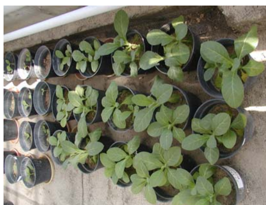
(شکل ۲) - عدم ایجاد علائم در گیاه غیر حساس توتون ( Nicotiana tabacum ) به BSBV در سمت راست و ایجاد لکه‌های کلروتیک و نکروتیک بسیار ریز در گیاه محک حساس سلمه ( Chenopodium quinoa ) به BSBV در سمت چپ