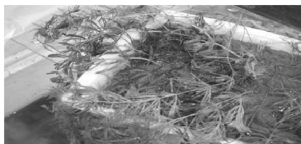
شکل ۱- تغییر رنگ ناشی از تنش نوری