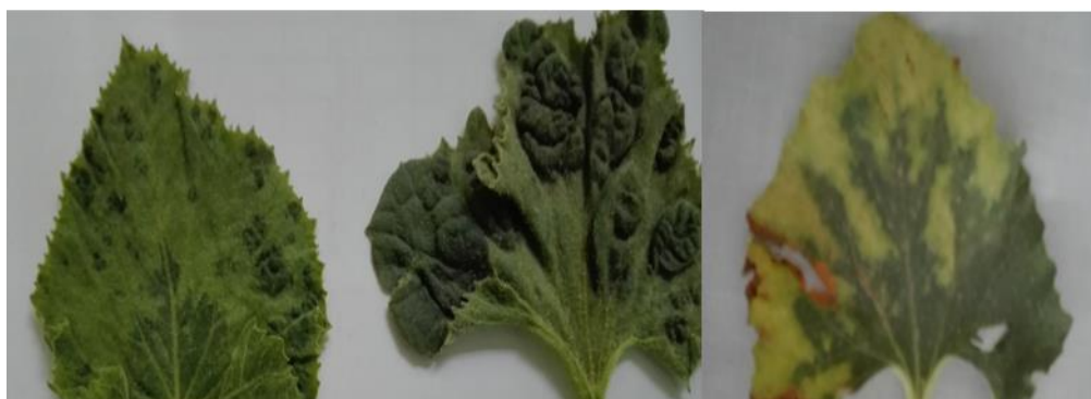
شکل ۱- علائم برگ‌های خربزه آلوده به ویروس موزاییک کدو Figure 1- Symptoms of melon leaves infected with SqMV

درصد) در آزمون الکتروفورز محرز شد در حالی که با استفاده از کیت تجاری شرکت دنازیست تنها ۵ نمونه (۲۰ درصد) آلودگی را نشان دادند. آزمون مولکولی با استفاده از RNA استخراج شده به روش CTAB قادر به شناسایی ویروس SqMV در هیچ یک از نمونه‌ها نبود. آزمون مولکولی با استفاده از RNA استخراج شده به روش GIT نیز تنها در ۲ نمونه (۸ درصد) قادر به ردیابی ویروس مذکور بود.